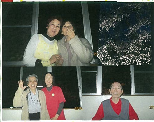
夜桜の美しさを写真ではお届けできないのが残念です。

平成28年4月4日(月) 和泉しあわせの丘で毎年恒例の居室からの夜桜見物が開催されました。今年も天候も良くライトアップされた夜桜はとても美しく咲き誇っておりその美しさに皆さん感動されていました。毎年美しい風景を見せていただく大自然的恵みに感謝です。